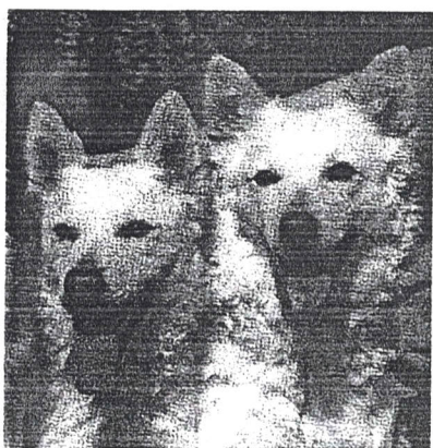
A Sacaházi kennel kutyái

Klubvacsoránkat a tavaszi tenyészszemle után, a késő délutáni, kora esti órákban tartottuk, a Strázsa KKI faházának emeleti társalgójában. A helyszín kötetlen baráti összejövetelekre alkalmas. Társaságunk nemcsak hivatalos, hanem ilyen alkalmakkor valóban baráti is. Hiszen évek óta összejárunk, együtt dolgozunk, jól ismerjük egymást. Az újak, a kezdők, mindig szívesen jönnek közénk. Itt nem rivalizálunk, a fajta érdekeit saját érdekeink elé helyezük. Elnökünk röviden beszámolt az eltelt 2000. év mudis vonatkozásairól, majd gratulált a tulajdonosoknak és a tenyésztőknek, miközben átadta a díjakat.