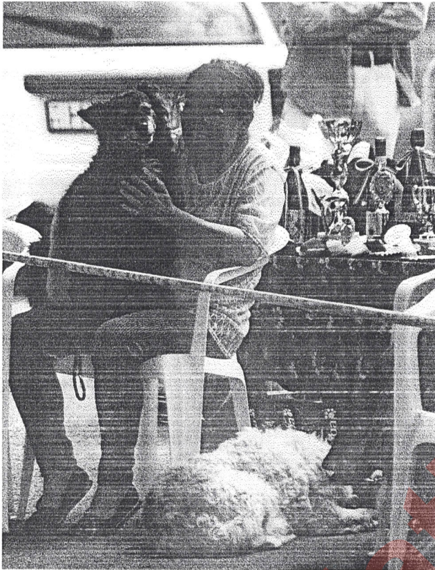
A korelnök mudi gazdájával és a díjakkal

2001-ben a Hungária Puli Klubbal és a Magyar Pumi Klubbal közösen rendeztük meg CAC klubkiállításunkat. Május 12-én borús reggel virradt ránk. Abban reménykedtünk, hogy az eső majd csak eláll. Végül elszántságunkat látva, az idő megenyhült, s mire a benevezett kutyák megérkeztek, a nap is kisütött. Jókedvűen beszélgettünk. Örültünk a jó időnek, a kellemes környezetnek.