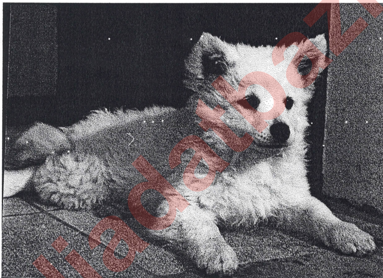
Jó pigmentű fehér szuka kölyök

A fehér színű mudi rendszerint fehérét örökítő feketék egymással, vagy fehérrel való párosításából származnak, általában szórványosan fordulnak elő, céltudatos tenyésztésükre néhány kivételtől eltekintve nem fordítottak hangsúlyt. Talán a sok tévedésre alkalmas körülmény a színmeghatározásnál, a kereslet hiánya, az érdektelenség és a sok kudarcra való lehetőség tántorította el a tenyésztők többségét attól, hogy komoly energiát fektessenek ebbe a színbe.